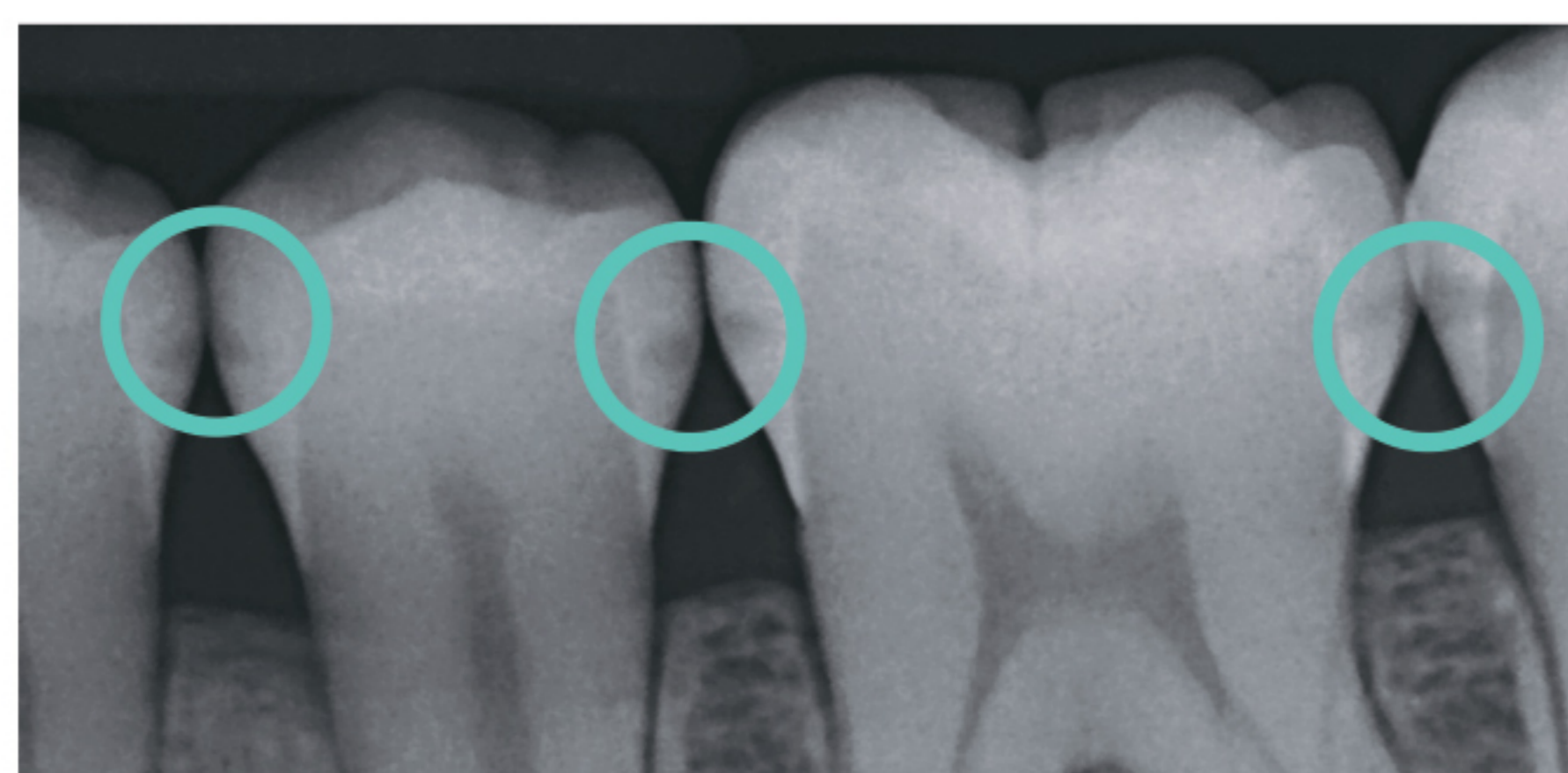
Кариес в межзубных промежутках на ранних стадиях можно выявить только методом рентгенографии.

Как только кариес доходит до определенной стадии, не остается другого выбора, кроме сверления, в процессе которого всегда разрушаются здоровые ткани зуба. Однако если вовремя обнаружить кариес, существует другой, менее инвазивный способ решения проблемы: инфильтрация материалом Icon.